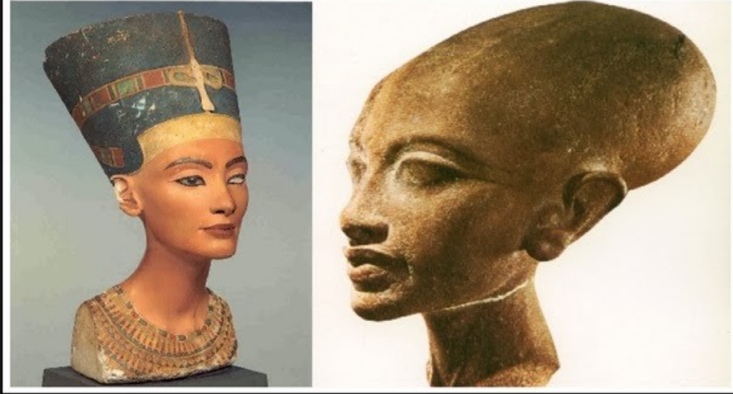
Two Busts of Queen Nefertiti, Wife of Paraoh Akhenaten, One With Royal Headdress, One Without

Nota alle loro tre figlie gli stessi teschi: